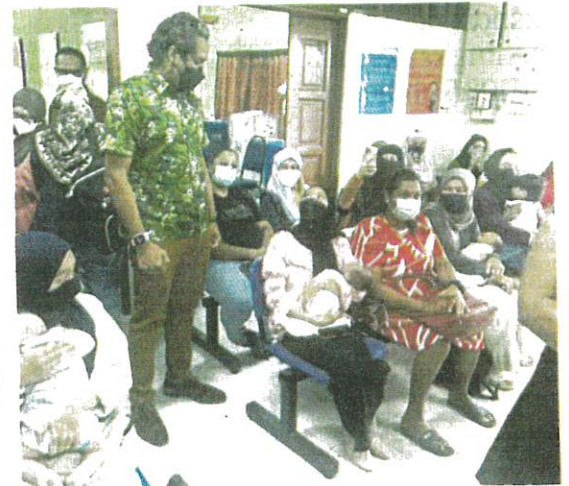
Khairy melawat Klinik Kesihatan Dengkil, semalam.

Sebelum ini, BH juga melaporkan beberapa hospital kerajaan mengalami kesesakan bagi menempatkan ibu bersalin hingga menyebabkan ada yang lewat mendapat katil berikutan keku-