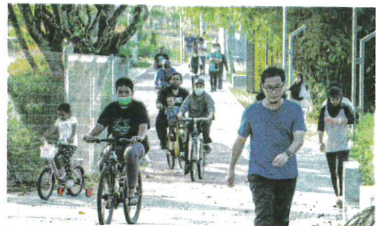
PENDUDUK disaran menjalani gaya hidup sihat bagi menjaga kesihatan jantung. – GAMBAR HIASAN

Tambahnya, inisiatif Saringan Kesihatan Kebangsaan yang dilaksanakan pada Julai lalu bagi menggalakkan masyarakat untuk menjalani saringan kesihatan.