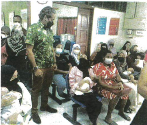
KHAIRY bertanya sesuatu kepada seorang wanita yang sedang memangku bayinya bagi mendapatkan perkhidmatan di Klinik Kesihatan Dengkil semalam.

Sebelum ini, Khairy turut melakukan lawatan menjelajah ke beberapa klinik kesihatan lain di seluruh negara bagi meninjau sendiri keadaan sebenar fasiliti terbabit.