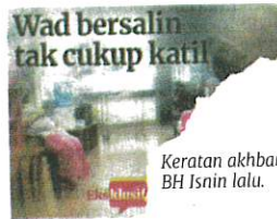
Keratan akhbar BH Isnin lalu.

Sebelum ini orang ramai di kawasan sekitar Dengkil meluahkan kekecewaan menerusi media sosial berhubung situasi kesesakan yang berlaku di Klinik Kesihatan Dengkil susulan peningkatan jumlah pesakit yang datang untuk mendapatkan rawatan di fasiliti kesihatan itu.